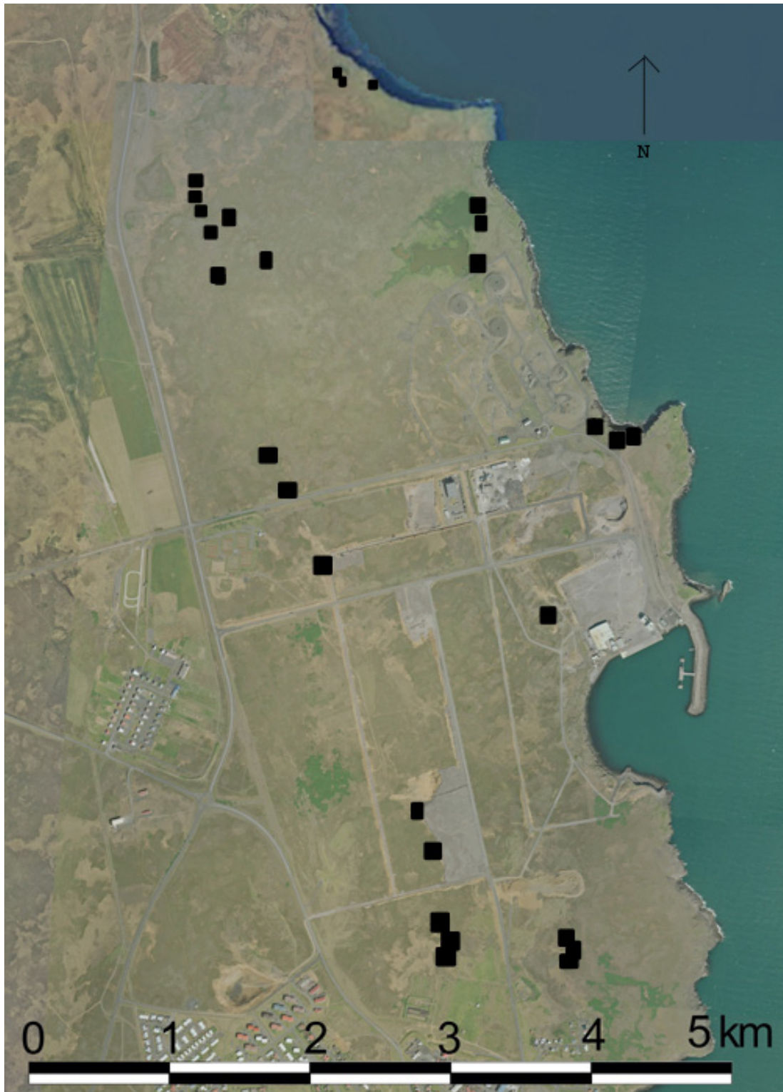
Kort yfir minjar hjá Helguvík.